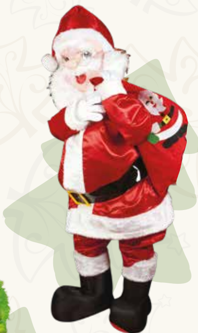
Art. 07 MASCOTTE BABBO NATALE