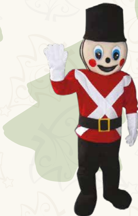
Art. 09 MASCOTTE SOLDATINO