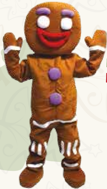
Art. 01 MASCOTTE PAN DI ZENZERO