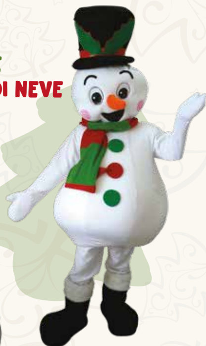
Art. 08 MASCOTTE PUPAZZO DI NEVE