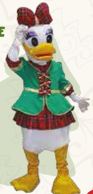
Art. 05 MASCOTTE PAPERA