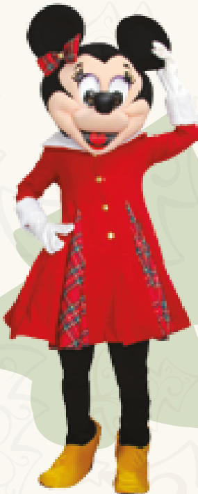
Art. 04 MASCOTTE TOPOLINA