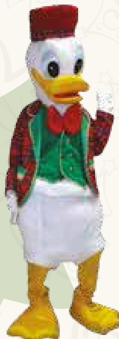
Art. 06 MASCOTTE PAPERO