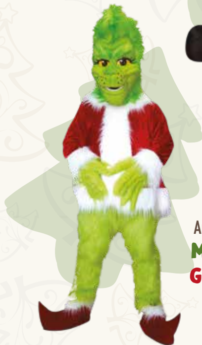
Art. 10 MASCOTTE GRINCH