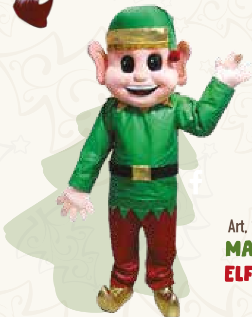
Art. 12 MASCOTTE ELFO