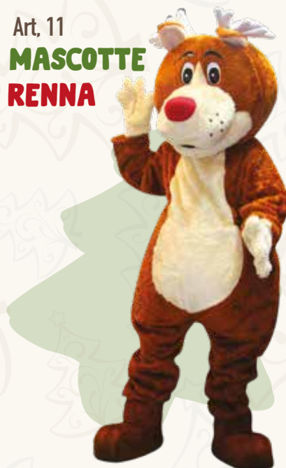
Art. 11 MASCOTTE RENNA