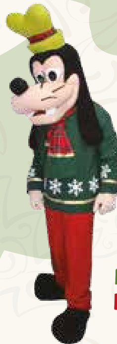
Art. 03 MASCOTTE PIPPO